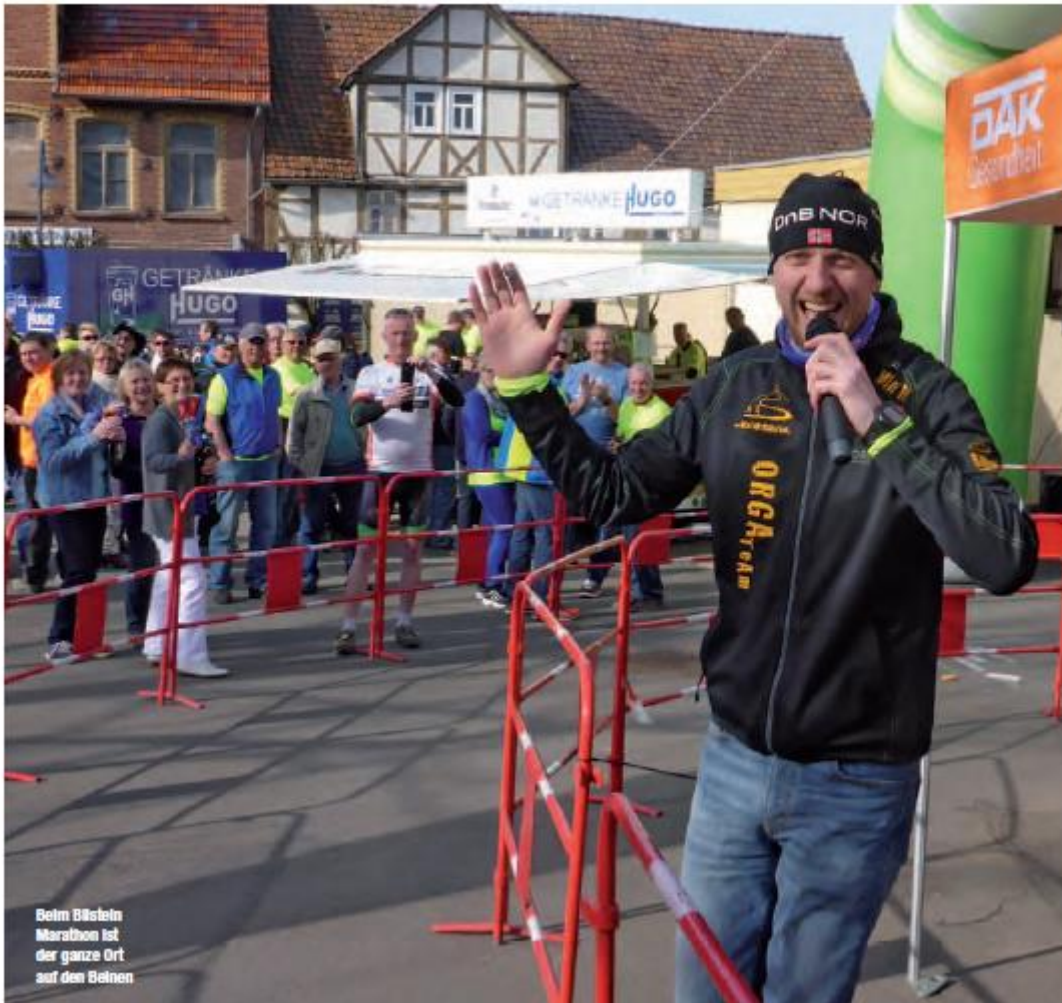
Beim Bilstein Marathon ist der ganze Ort auf den Beinen